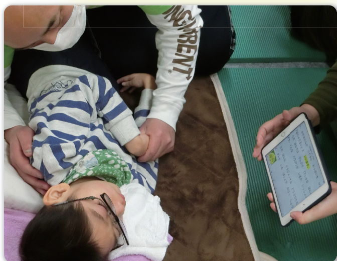
(タブレットで読書を楽しむ キッズサポートリマ)